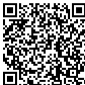
Рисунок 4 — Сценарий для проведения дебатов «Идеология радикализма»

Первая команда всегда будет представлять сторону радикальной идеологии. Задача команды студентов – найти контраргументы тех радикальных и спорных тезисов, которые будет озвучивать первая команда. Тем самым, участники будут вынуждены критически рассматривать постулаты радикальных идеологий, искать в них логические ошибки, несоответствия – самостоятельно приходить к выводу о деструктивности любой радикальной идеологии (см. рисунок 4).