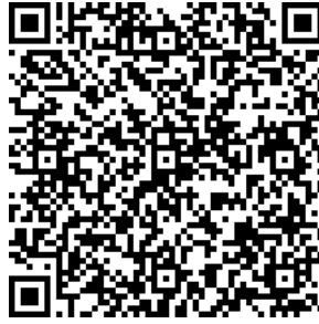
Рисунок 7 — Сценарий тематической викторины с примерами вопросов

В каждом из перечисленных мероприятий важно отслеживать активность участников, высказываемыми ими мнения, их настрой в целом. На таких мероприятиях необходимо присутствие психолога для фиксации активности и оценки их поведения.