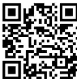
Рисунок 6 — Рекомендации по проведению кинопоказов в профилактике

Среди фильмов по тематике противодействия терроризму можно использовать следующие фильмы: «Беслан. Память» (Россия, 2014 г., возрастное ограничение: 12+), «Кавказский пленник» (Россия, 1996 г., возрастное ограничение: 18+), «Я не террорист» (Узбекистан, 2021 г., возрастное ограничение: 18+), «Отель Мумбаи: противостояние» (США, Австралия, 2018 г., возрастное ограничение: 18+) и т.д.