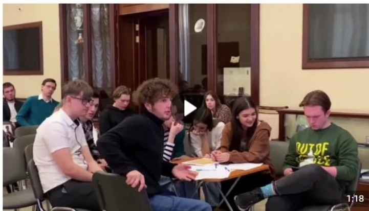
Дебаты «Идеология радикальных организаций» 1 888 просмотров

В рамках дебатов можно: развенчивать мифы, декларируемые представителями радикальных идеологий для вербовки; развивать навыки критического мышления и ведения дискуссии; формировать в целом антитеррористическое сознание и активную гражданскую позицию. Рекомендуется для мероприятия вовлекать не более 20 человек (см. рисунок 5).