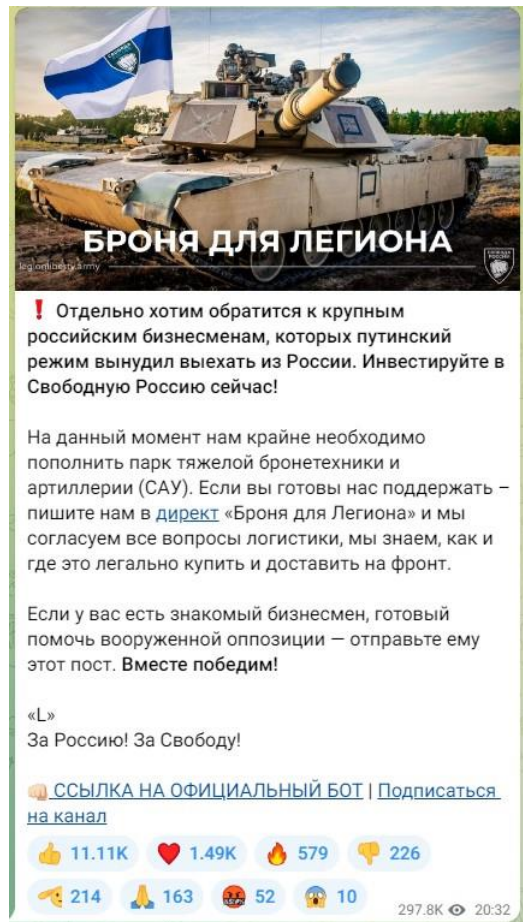
Рисунок 3 — Скриншот телеграм-канала легиона «Свобода России» с призывом к финансированию

Важно подчеркнуть, что помимо собственно пропаганды и распространения идеологии террористических организаций, а также вовлечения в деятельность террористических организаций существует еще одна угроза террористического характера — ложные сообщения о готовящемся террористическом акте. Только за 2021 год зафиксировано более 4,5 тысяч ложных сообщений о готовящихся терактах на объектах социальной инфраструктуры. Это может быть хулиганство, злой умысел, специфическое чувство юмора, желание проверить качество работы правоохранительных органов или антитеррористическую защищенность объекта и др. Во всех вышеперечисленных случаях за такой поступок придется нести уголовную ответственность. Ведь злоумышленник нарушает конструктивную деятельность общественных объектов, а правоохранителям приходится задействовать множество средств и сил, чтобы проверить объекты, которые якобы находятся под угрозой. За ложное сообщение о готовящемся теракте правонарушитель может быть наказан либо штрафами – от 200 тысяч рублей и до двух миллионов рублей, либо лишением свободы – от одного года до 10 лет. Ответственность за данный вид правонарушения наступает с 14 лет (статья 207 УК РФ «Заведомо ложное сообщение о акте терроризма»).