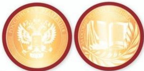
Медаль «За особые успехи в учении» I степени (золотая)