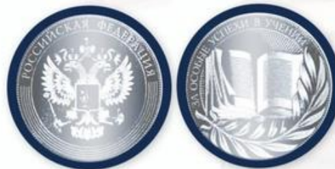
Медаль «За особые успехи в учении» II степени (серебряная)