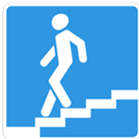
Подземный пешеходный переход